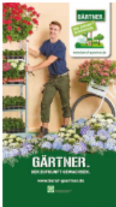
Roll-ups, Größe: 1,27 m Breite x 2,27 m Höhe (inkl. 8 cm Schutz)

Plakate, Roll-ups und Flyer sind in zahlreichen Varianten bestellbar