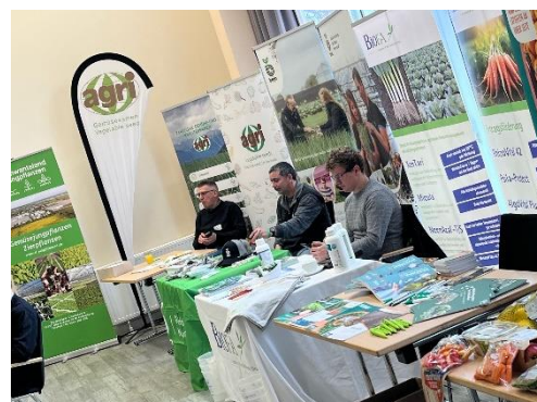
Sponsoren präsentieren sich