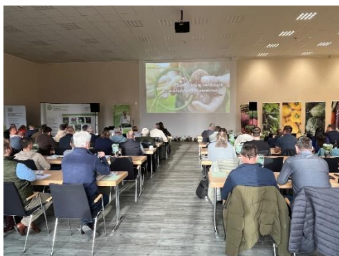
Voller Veranstaltungssaal Gemüsebautag 2025